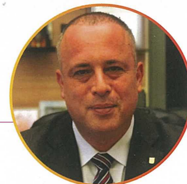
ח"כ וסגן יו"ר הכנסת חיליק (יחיאל) בר

לכבוד הועד המנהל "מנהיגות ישראלית בתפוצות"